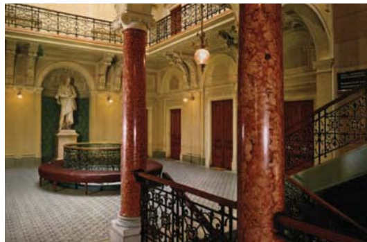
Хол генеральної дирекції у м. Грац

Упродовж майже двох століть GRAWE живе та розвивається виключно на власному капіталі, без будь-яких запозичень та пов'язаних з цим ризиків. А висококваліфіковані спеціалісти компанії-засновника, що знаходиться в Австрії у місті Грац, координують роботу усіх компаній, гарнтуючи власним досвідом надійність та бездоганну якість обслуговування клієнтів.