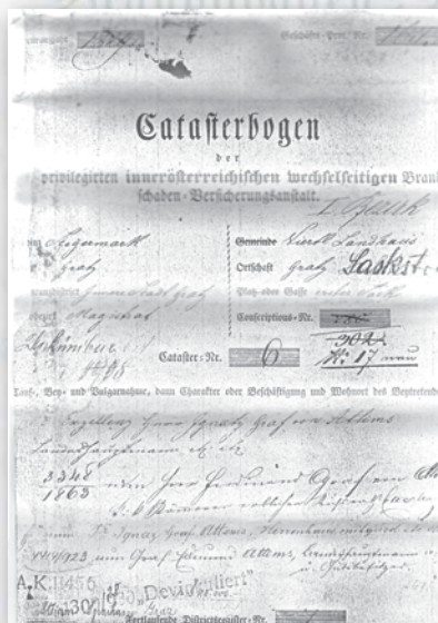
Договір, укладений 1829 року, який діє і донині

Ерцгерцог Йоган (повне ім'я - Johann Baptist Joseph Fabian Sebastian von Habsburg). Впливовий політик на міжнародній арені, рідний брат імператора Австрійської імперії