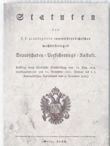
Статут 1829 року

GRAWE створювалася у 1828 році за «найвищим наказом» кайзера як «імператорсько-королівське привілейоване товариство... (Kaiserlich-königliche privilegierte innerösterreichische wechselseitige Brandschaden-Versicherungs-Anstalt für Steiermark, Kärnten und Krain), а сьогодні - це сучасний західноєвропейський незалежний концерн.