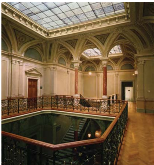
Хол генеральної дирекції у м. Грац

До складу концерну входять понад 20 страхових компаній, 3 банки і, окрім того, компанії, які використовують різноманітні фінансові інструменти для найнадійнішого інвестування – це GRAWE Immobilien (компанія з нерухомості, у власності якої перебуває декілька мільйонів квадратних метрів нерухомості), Security KAG – компанія, що керує понад 50 фондами.